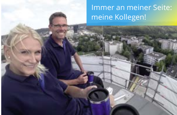
Immer an meiner Seite: meine Kollegen!