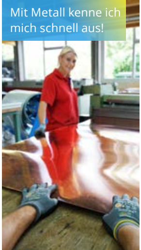
Mit Metall kenne ich mich schnell aus!