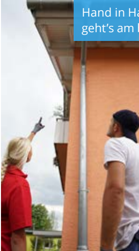
Hand in Hand geht's am besten!