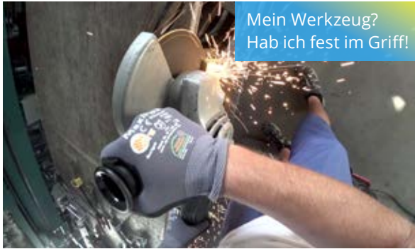
Mein Werkzeug? Hab ich fest im Griff!